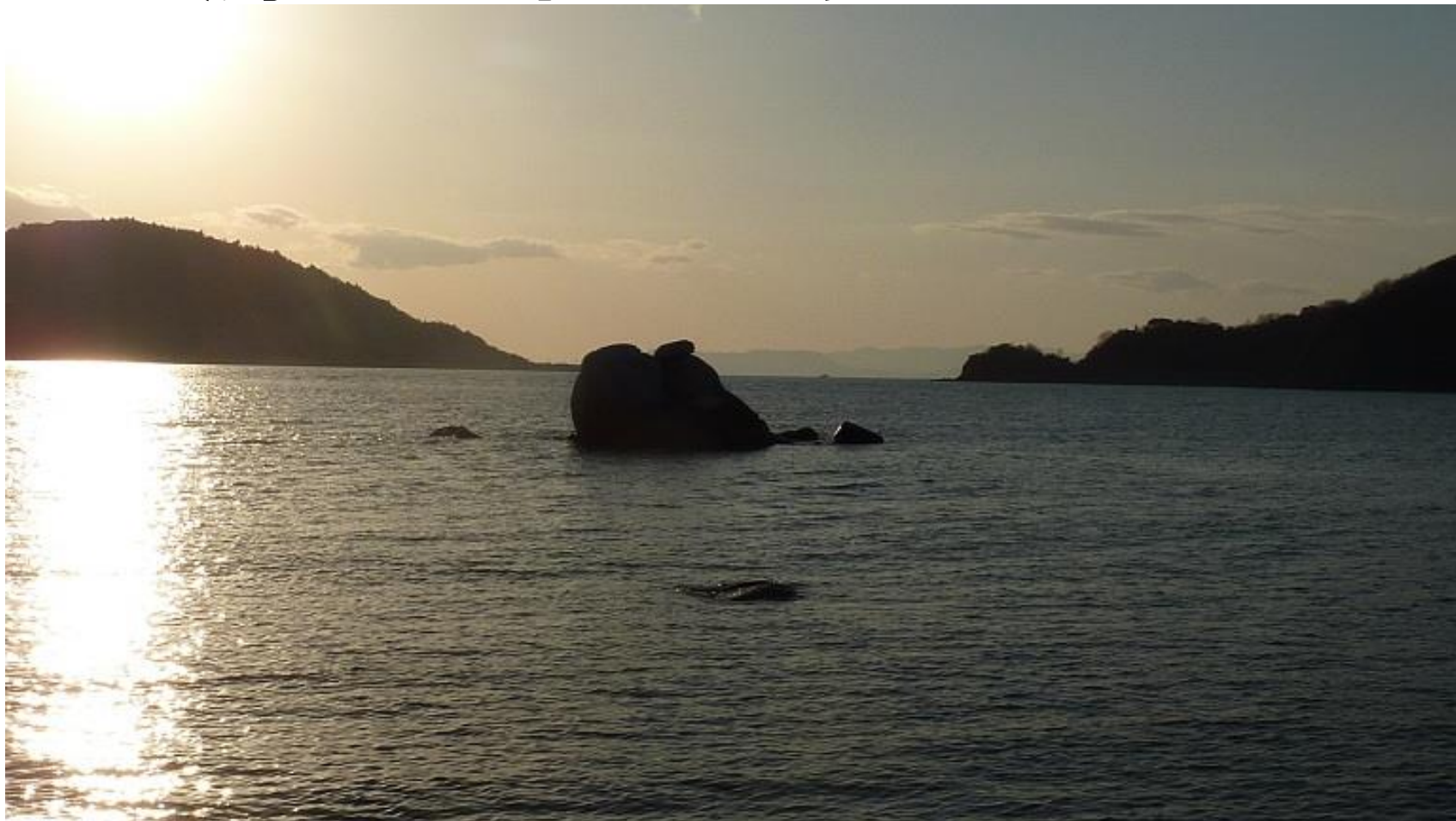
満潮時のカサネ石