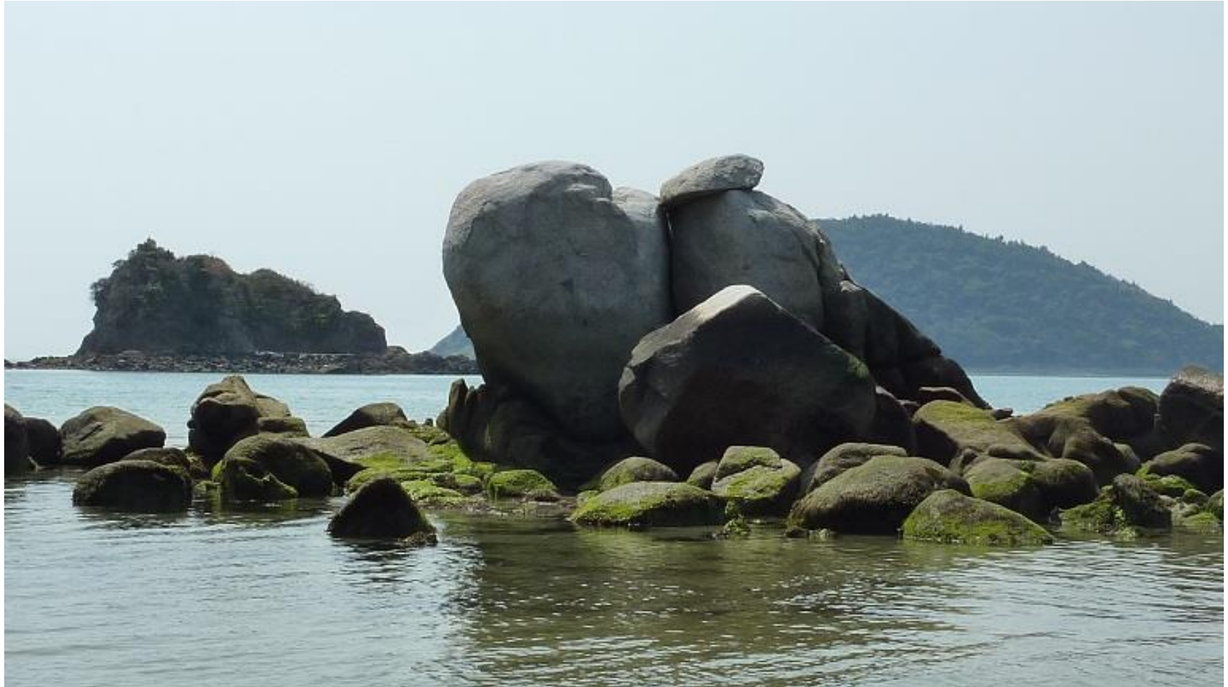
干潮時のカサネ石